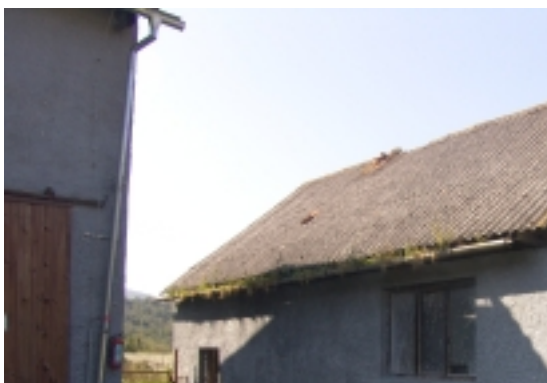
Pohľad na budovu skladu agrochemikálií.